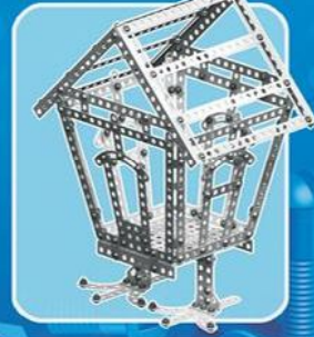
Избушка на курьих ножках